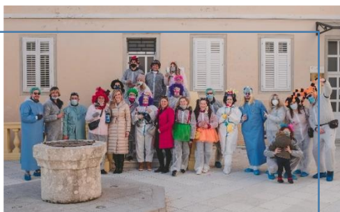
Prijem pripadnika udruga u zgradi Općine Omišalj.