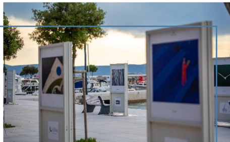
Izložba na otvorenom "Prijatelji mora: Geometrije" u Njivicama.

Sunday Jazz & World music 09. srpnja – Jan Sturiale kvartet u Omišlju