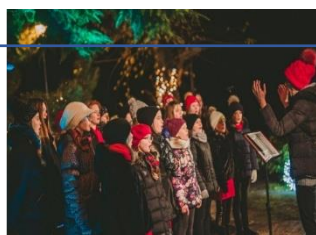
Koncert Pjevačkog zbora mladih „Josip Kaplan