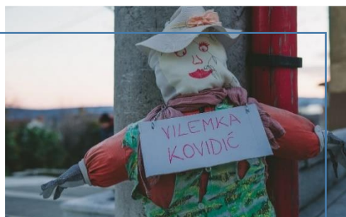
Ime ovogodišnjeg Pusta - Vilemka Kovidić.