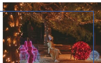
Božićna dekoracija i rasvjeta za sreću velikih i malih

Uz Čarobni svijet orašara, veliko božićno drvece, prigodno dekorirani photopoint te raskošna dekoracija s tisuće lampica duž Ribarske obale u Njivicama nije nedostajalo zbivanja: