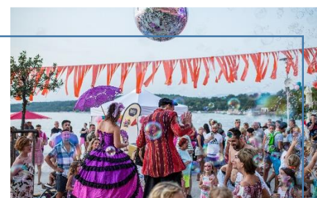
Festival sladoleda razveselio je svojim programom i male i velike.

Klasika na Mirinama 15. srpnja – Zagrebački kvartet Festival sladoleda održan je 24. i 25. srpnja u Njivicama. Festival se održava od 2018. godine u suradnji s Hotelima Njivice, današnjim Aminess hotels & campsites resortom na lokacijama kampa Athea, lounge bara Veya i duž Ribarske obale. Na sve tri lokacije postavljeni su zanimljivi sadržaji poput maštovitih foto pointa, promenadnih nastupa i sve to uz mađioničare, ulične akrobate, face-painting, kreativne radionice i animaciju za djecu.