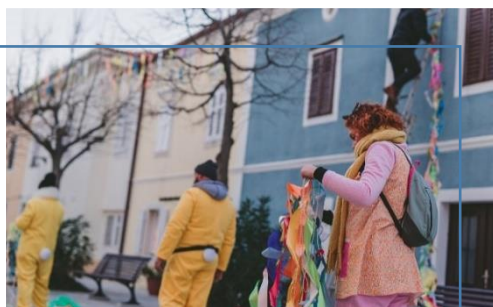
Trg Prikešte i Placa u Omišlju prigodno su dekorirani trakicama.

Karnevalske udruge svoj doprinos dale su i video materijalom za Riječki karneval 2021. koji su snimali na području Općine Omišalj obučeni u neke od prepoznatljivih maski s prethodnih karnevala.