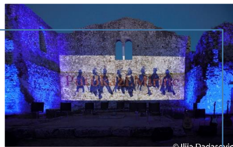
Grupa "Putokazi" predstavili su novi album "Meandri."

Otvorenje srpanjske kulturne scene na lokalitetu arheološkog parka Fulfinum-Mirine održalo se 2. srpnja s početkom u 21.00 sati koncertom „ Putokaza. “ Legendarni riječki "Putokazi" glazbenoj javnosti predstavili su svoj 14. album "Meandri". Ova jedinstvena glazbena pojava na sceni punih trideset i sedam godina postojanja, iz albuma u album, iz generacije u generaciju, kroz više od 400 pjevača hrabro istražuje, promišlja glazbu izvan okvira i s prepoznatljivim osmijehom čuva ono što se danas rijetko nailazi - predanost ideji i pristup izbrušen do savršenstva.