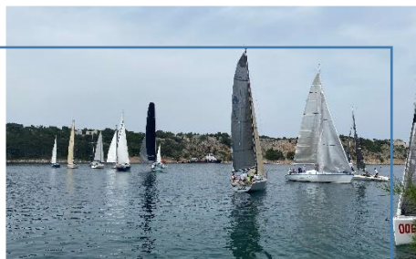
Natjecatelji su ostvarili odlične rezultate u 9 kategorija regate.