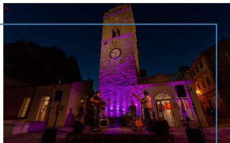
Koncertna pozornica - placa u Omišlju.