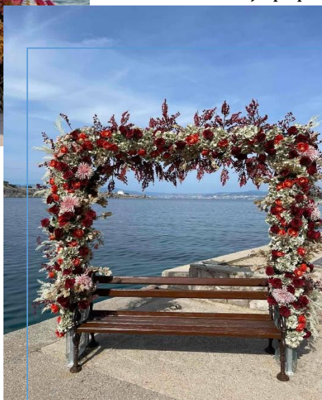
Jesenski izgled photo pointa u Omišlju.

U svrhu što bolje promocije destinacije i praćenja trenutnih trendova u Omišlju na šetnici i u Njivicama na Ribarskoj obali, tik do mora, postavljeni su proljetno-cvjetni photo pointi , koji su savršeno uokvirili svaku fotografiju i mnogima ju učinili posebnom uspomenom iz Općine Omišalj. Projekt je zaživio tokom proljeća a posebna dekoracija tematski određena sezonskim dobom ide dalje – nakon ljeta, jesenske dekoracije, na red je došla i zimska, adventska verzija popularnog photopointa.